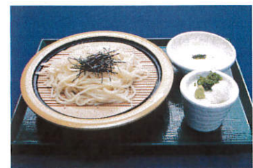
冷やし山かけうどん 写真はイメージです

※上記麺類はうどん・そばと同じ釜でゆがいております ※上記料金は消費税込みの料金となっております