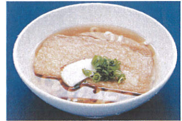
きつねうどん・そば 写真はイメージです