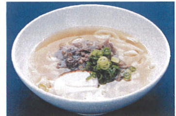
肉うどん・そば 写真はイメージです